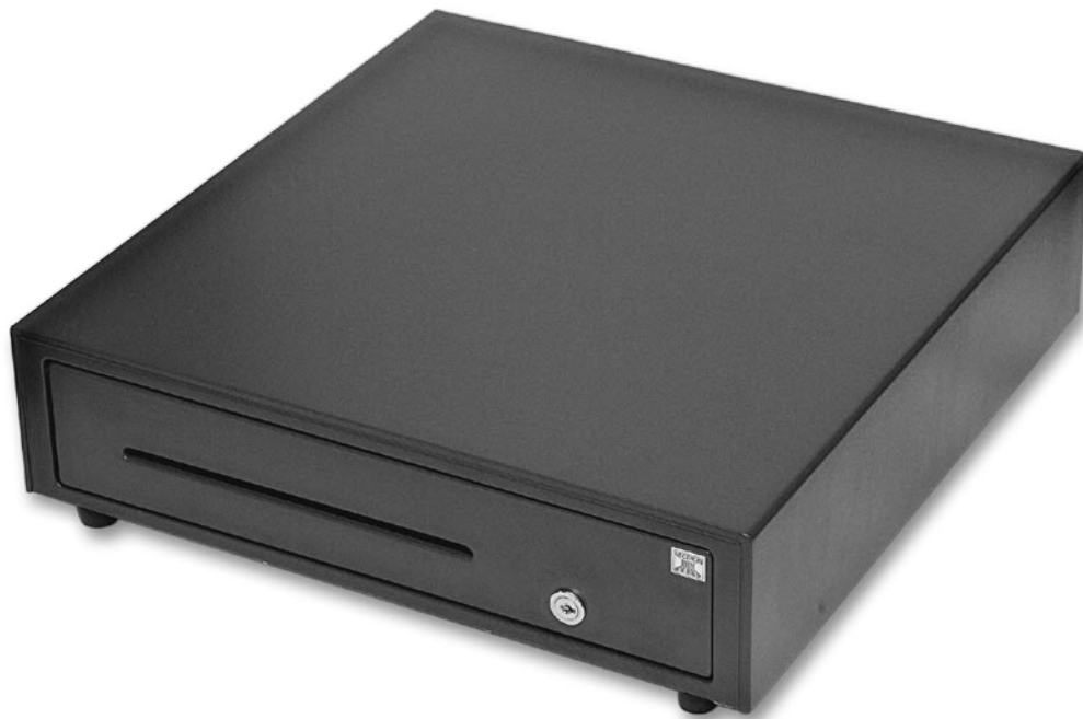
Abb. 2: Kassenschublade Vectron DR20, anthrazit