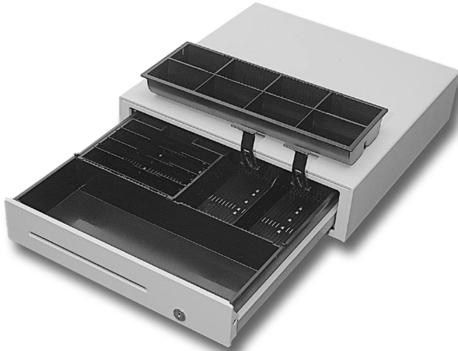
Abb. 1: Kassenschublade Vectron DR20, hellgrau